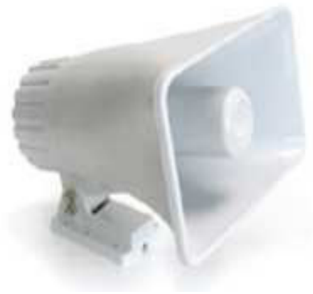
Sirene Eletrônica bitonal SR112 - 024 VdC